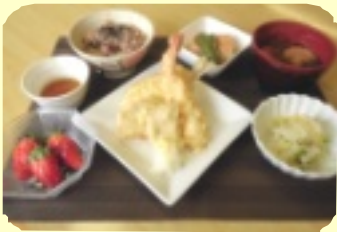
今年最初の誕生日お祝い膳

今年も御利用者の皆様に喜んで頂ける食事を栄養課一同、作ってまいります。よろしくお願い致します。郷土料理のリクエストも引き続き募集中です!