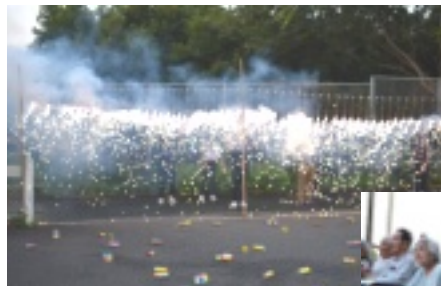
ナイヤガラの滝花火！