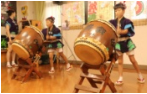
鼓鶴会による和太鼓演奏

夏のメイン行事である納涼祭を7月20日に行いました。昨今の猛暑で利用者様やボランティアの方々の暑さ対策と負担軽減の為、出店やゲーム、鼓鶴会和太鼓と盆踊りを館内で行いました。